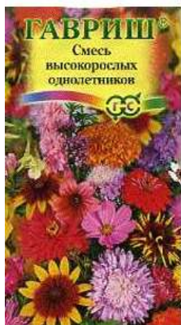
Декоративная смесь высокорослых однолетников