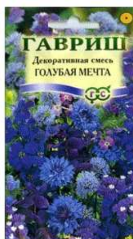
Декоративная смесь Голубая мечта