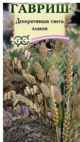
Декоративная смесь Злаков

Доверьте подбор цветочной композиции Вашего сада профессионалу!