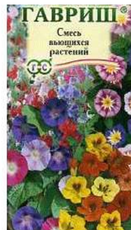
Декоративная смесь Вьющихся однолетников