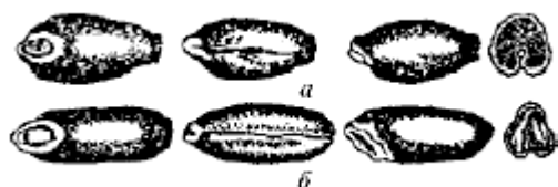
Семена пшеницы: а - мягкой; б - твердой

1.1.3.2. Определение краснозерной и белозерной пшениц проводят визуально по окраске семян на тех же пробах (две пробы по 1000 шт. семян).