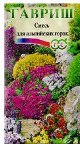
Декоративная смесь Для альпийских горок

Результат обучения: умение подготавливать семена к хранению и оформлять документацию на семенной материал.